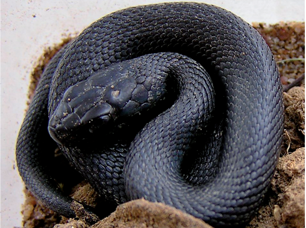
Fig. 7. Spaanse ringslang ( Natrix astreptophora ) (melanistisch) Cantabrië, Spanje. (Foto Paul Storm, 2004). Fig. 7. Iberian grass snake ( Natrix astreptophora ) (melanistic) Cantabria, Spain. (Picture Paul Storm, 2004).

(Storm, 2016). Aangezien dobbelsteenslangen niet kieskeurig lijken wat hun leefomgeving betreft, zolang er maar water in de buurt is, is de kans groot is dat ze in dezelfde habitat worden aangetroffen als ringslangen.