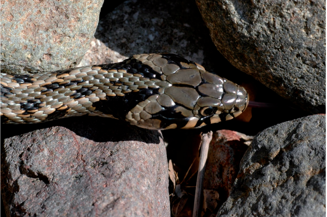
Fig. 14. Ringslang ( Natrix natrix persa ), Lesbos, Griekenland. Fig. 14. Grass snake ( Natrix natrix persa ), Lesbos, Greece.

kop hadden dan individuen met kikkers in hun maag. Bovenstaande suggereert voorzichtigheid wat betreft een te nauw beeld ten opzichte van de ecologische niche van dobbelsteenslangen.