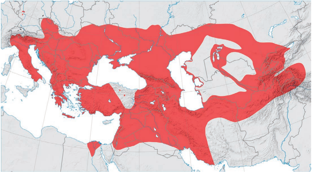
Fig. 3. Verspreidingsgebied van de Dobbelsteenslang ( Natrix tessellata ). (Bron: Wikipedia). Fig. 3. Distribution area of the Dice snake ( Natrix tessellata ). (Source: Wikipedia).

voorkomen: 'complete competitors cannot coexist'. Competitie tussen de twee soorten zal ervoor zorgen, dat slechts één van de twee zal overleven, namelijk degene die (net iets) beter is in het bezetten van de betreffende ecologische niche. In dit artikel wordt met ecologische niche, ook wel kortweg niche, bedoeld op de rol van een organisme binnen een leefgemeenschap, in het bijzonder wat betreft zijn voedselconsumptie. Niet te verwarren met de term 'habitat', want hiermee wordt de omgeving waarin een soort voorkomt, bedoeld.