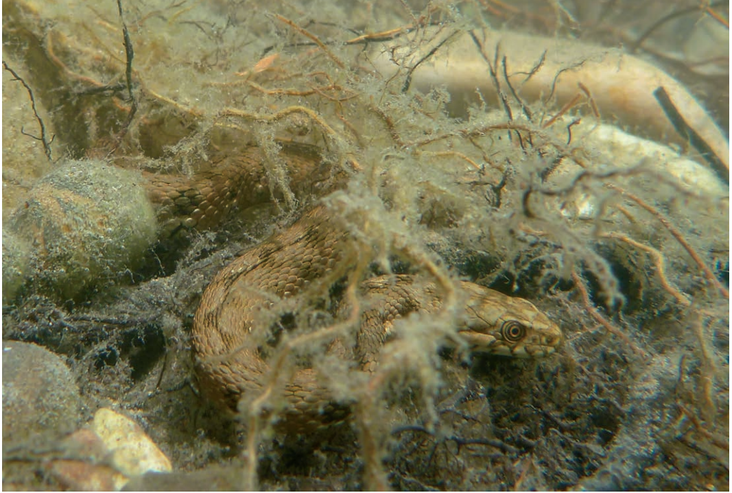
Fig. 15. Adderringslang ( Natrix maura ), onderwater in een meertje in de Provence, Frankrijk, waarschijnlijk op jacht.