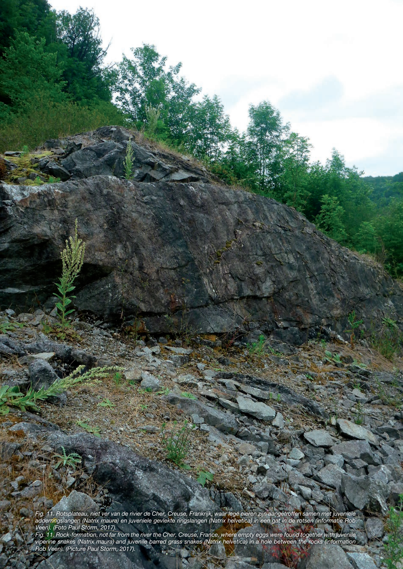
Fig. 11. Rotsplateau, niet ver van de rivier de Cher, Creuse, Frankrijk, waar lege eieren zijn aangetroffen samen met juveniele adderringslangen ( Natrix maura ) en juveniele gevlekte ringslangen ( Natrix helvetica ) in een gat in de rotsen (informatie Rob Veen).