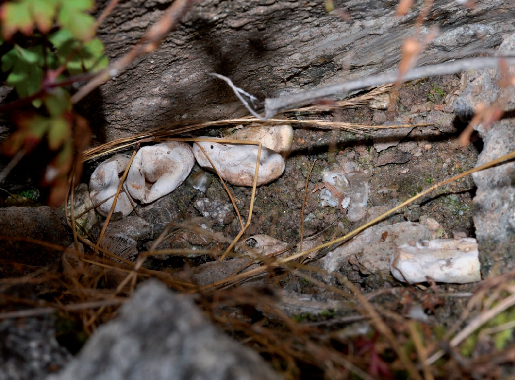
Fig. 12. Het gat in het rotsplateau (Fig. 11) waar (nog zichtbare) lege eieren zijn aangetroffen samen met juveniele adderringslangen ( Natrix maura ) en juveniele gevlekte ringslangen ( Natrix helvetica ) (informatie Rob Veen). (Foto Paul Storm, 2017).