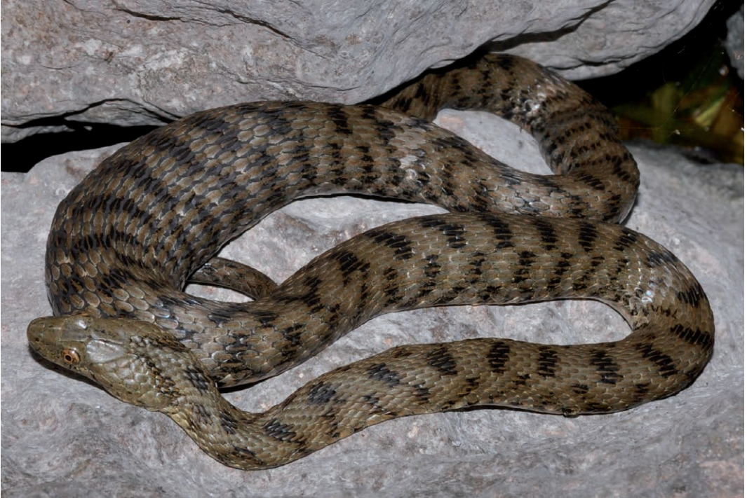
Fig. 13. Dobbelsteenslang ( Natrix tessellata ), Gardameer, Italië. Deze slang heeft duidelijk nog niet zolang geleden gegeten.