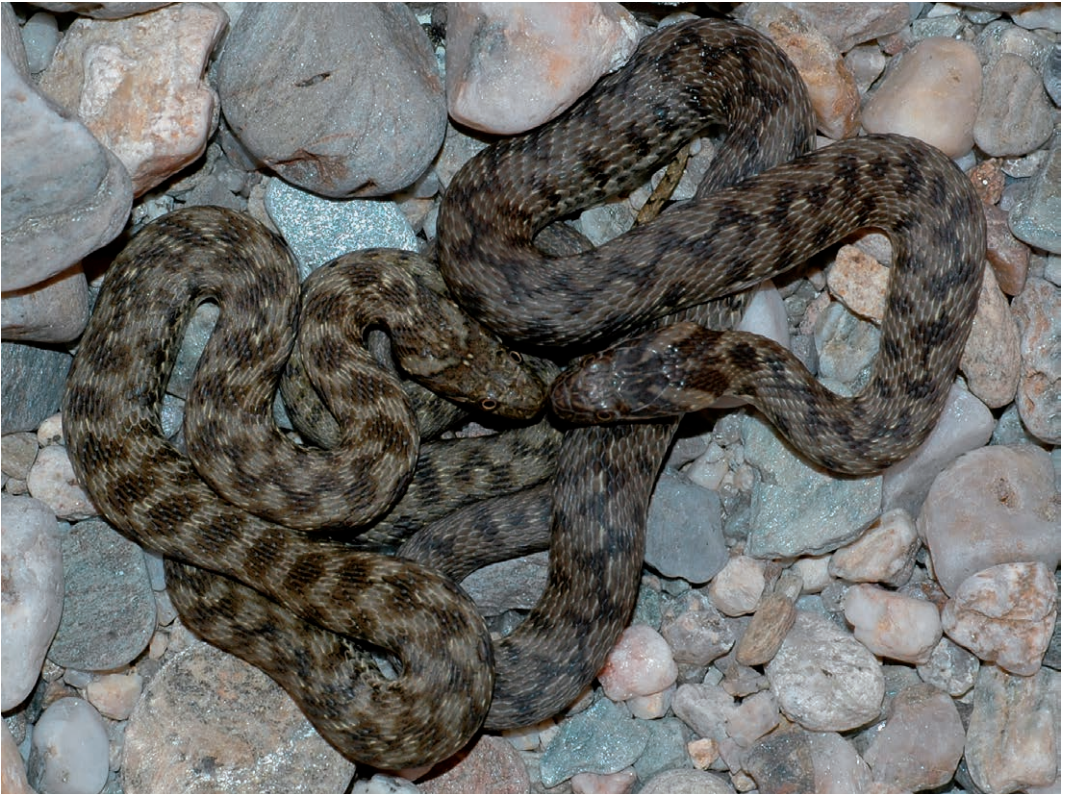
Fig. 10. Adderringslang ( Natrix maura ), Gard, Frankrijk. (Foto Paul Storm, 2011). Fig. 10. Viperine snake ( Natrix maura ), Gard, France. (Picture Paul Storm, 2011).

vertonen zowel adderringslangen als dobbelsteenslangen vijf duidelijke jachtstrategieën, die te verdelen zijn in passieve en actieve manieren van jagen: