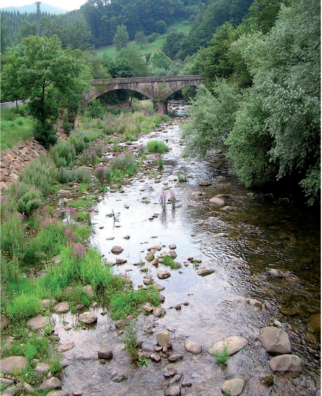
Fig. 4. Rio Nansa, Cantabrië, Spanje, waar de Spaanse ringslang ( Natrix astreptophora ) en de Adderringslang ( Natrix maura ) zijn aangetroffen. (Foto Paul Storm, 2004).

Fig. 4. Rio Nansa, Cantabria, Spain, where the Iberian grass snake ( Natrix astreptophora ) and the Viperine snake ( Natrix maura ) were found. (Picture Paul Storm, 2004).