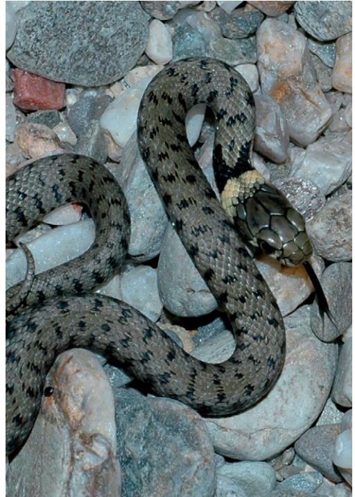
Fig. 9. Gevlekte ringslang ( Natrix helvetica ), Gard, Frankrijk.

Interessant is dat ook Ioannidis & Mebert (2011) constateerden dat in het zuiden van Griekenland dobbelsteenslangen en ringslangen weliswaar de meeste beschikbare habitats in de buurt van water gebruiken, maar dat er een verschil is tussen beide wanneer je inzoomt op de verschillende typen waterrijke gebieden. Zo maken ringslangen, in tegenstelling tot dobbelsteenslangen, vooral gebruik van tijdelijke plassen, natte graslanden, moerassen en kleine kunstmatige greppels. Daarentegen zijn dobbelsteenslangen vaker aangetroffen bij brak- en zoutwaterlagunes. Het kan haast niet anders dat deze habitatvoorkeuren in verband staan met de favoriete prooi van beide groepen. De verschillen in habitatvoorkeuren van ringslangen en dobbelsteenslangen (Janev Hutinec & Mebert, 2011; Ioannidis & Mebert, 2011) doen deels ook denken aan de eerder aangehaalde opmerking van Rob Veen over de habitatkeuzen van gevlekte ringslangen en adderringslangen in de Creuse. Dit zou kunnen betekenen dat dobbelsteenslangen en adderringslangen ecologisch gezien dicht bij elkaar staan en dienovereenkomstig de kans op competitie tussen deze twee soorten groter is.