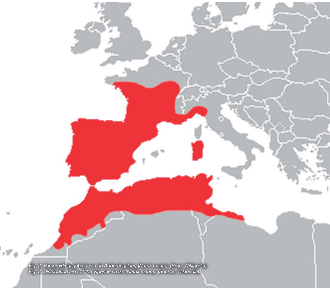
Fig. 2. Verspreidingsgebied van de Adderringslang ( Natrix maura ). (Bron: Wikipedia).