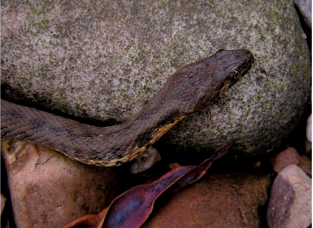
Fig. 6. Adderringslang ( Natrix maura ), Cantabrië, Spanje. (Foto Paul Storm, 2004). Fig. 6. Viperine snake ( Natrix maura ), Cantabria, Spain. (Picture Paul Storm, 2004).

De gevlekte ringslang heb ik samen met de adderringslang aangetroffen in Frankrijk, langs rivieren met veel keien, zoals bij de Ceze en de Gardon d'Anduze (Tabel 1; Fig. 8, 9 & 10). Beide slangensoorten zijn ook in de Limousin in de buurt van de Petite Creuse aangetroffen, bij een stuk met veel keien, maar niet in hetzelfde jaar. Bovendien trof ik de gevlekte ringslang hier wat verder van het water aan. Hiermee komt de vraag op, of het samen voorkomen van deze twee waterslangsoorten mogelijk niet alleen een kwestie is van niche, maar ook van (micro)habitat. Dit laatste zou betekenen dat er op kleinere schaal wel degelijk sprake kan zijn in bepaalde gebieden van een gedeeltelijke scheiding van gevlekte ringslangen en adderringslangen. In 2002 vroeg ik aan Rob Veen wat zijn idee was over het naast elkaar kunnen leven