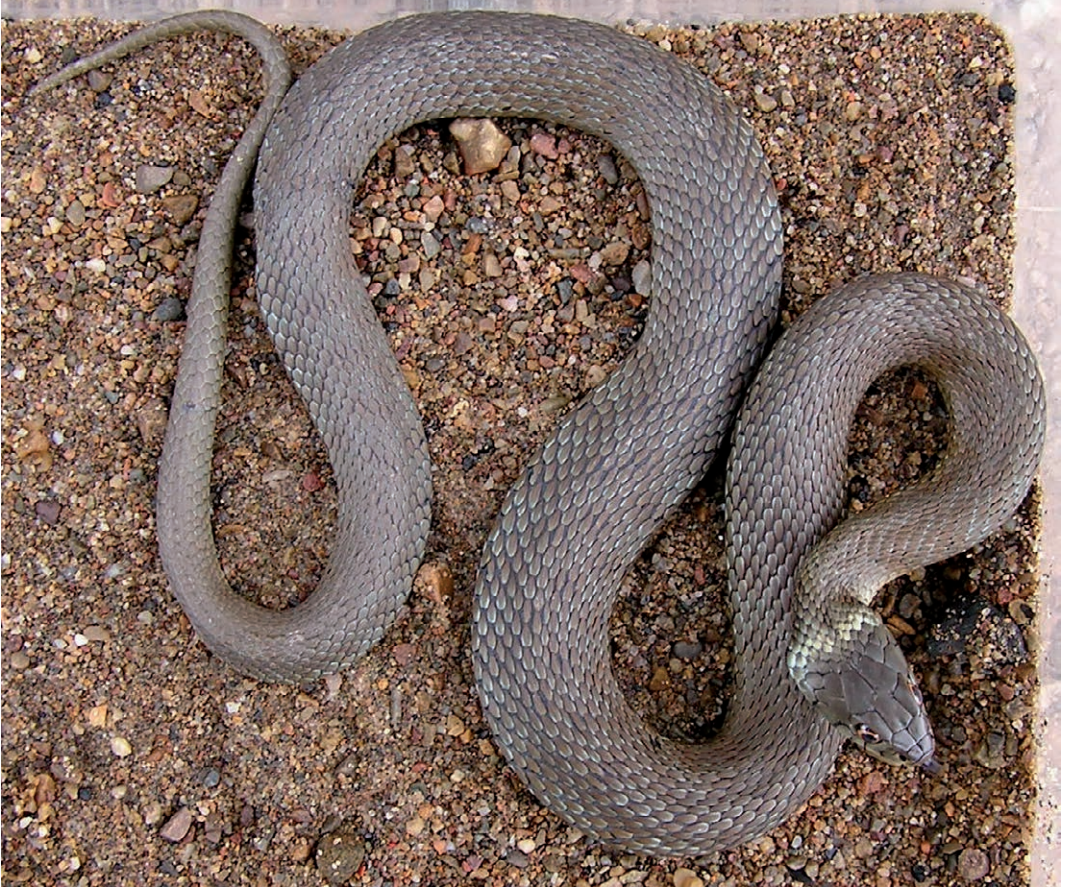
Fig. 5. Spaanse ringslang ( Natrix astreptophora ), Cantabrië, Spanje. (Foto Paul Storm, 2004).