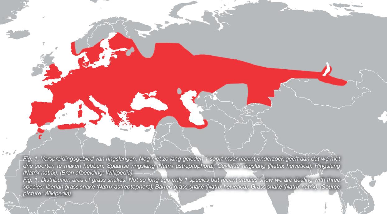
Fig. 1. Verspreidingsgebied van ringslangen. Nog niet zo lang geleden 1 soort maar recent onderzoek geeft aan dat we met drie soorten te maken hebben: Spaanse ringslang ( Natrix astreptophora ); Gevlekte ringslang ( Natrix helvetica ); Ringslang ( Natrix natrix ). (Bron afbeelding: Wikipedia).